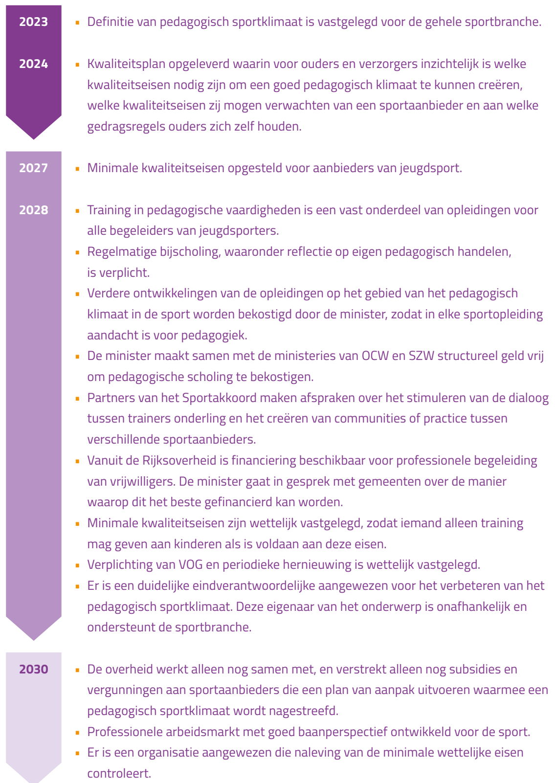
Figuur 3. Tijdlijn aanbevelingen.