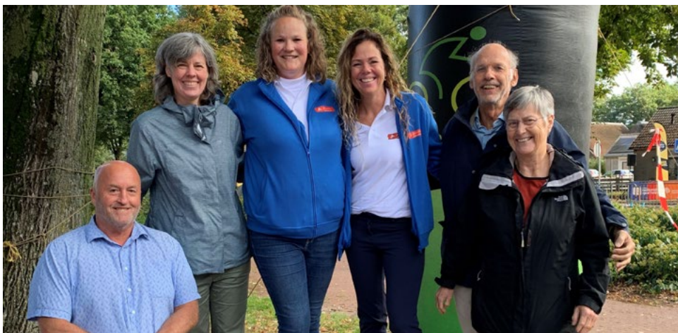
Werkbezoek Drenthe voor het adviestraject Bewegen tijdens de levensloop tijdens het EK Wielrennen