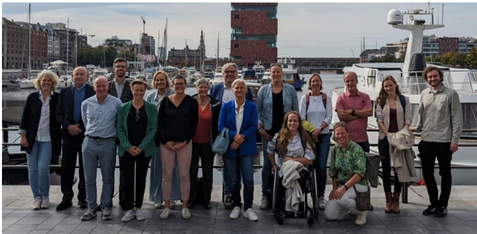
Werkbezoek van de NLsportraad aan de Vlaamse Sportraad in Antwerpen op 26 september 2023

De NLsportraad laat tijdens bijeenkomsten foto's maken. Dat gebeurde bijvoorbeeld op het symposium Bewegen in de Haagse werkelijkheid van 19 december 2023. De raad laat ook foto's maken bij de aanbieding van een advies aan een bewindspersoon. Deze foto's worden gebruikt voor nieuwsberichten op de website, X, LinkedIn en nieuwsbrief van de NLsportraad. Ook maakt de NLsportraad via de raamovereenkomst van de rijksoverheid gebruik van werk van ANP-foto en Hollandse Hoogte.